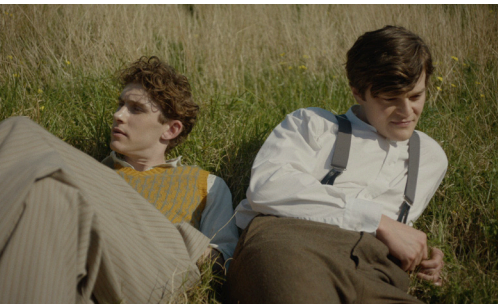
Lilies Not For Me

Para cualquier duda podéis consultar a nuestro equipo en salas o al mail films@lesgaicinemad.com .